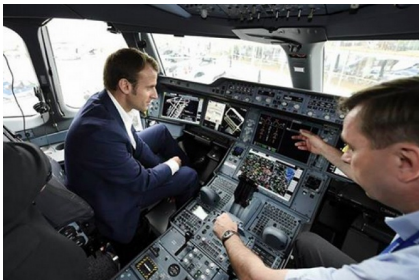
Emmanuel Macron dans un cockpit d'A350 en 2015.

Car la règle capitaliste est simple et tous jouent la même, même si le gouvernement s'évertue à le nier derrière les grands mots de champions mondiaux, européens ou intergalactiques : le vainqueur, le plus fort emporte tout, le siège, les activités, la R&D, les emplois, ne laissant que des lambeaux.