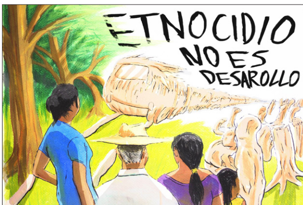
Imagen 1. Tren Maya: Etnocidio no es desarrollo.

Algunxs mayas, aún en este contexto, resisten. Son lxs que hoy reclaman que el proyecto del Tren “Maya” es ecocida por toda la devastación que realizara al territorio, las aguas, la selva, las plantas y los animales; es etnocida porque desaparecerá al pueblo maya, su cultura, su lengua, su territorio; es un engaño porque no se trata solamente de un tren sino de una serie de proyectos que en su conjunto destruirán la Península, y porque es un tren que le llaman maya, pero no es maya, ni es para su beneficio. Este tren no ayudará al pueblo maya con ‘desarrollo’, ‘empleo’ y ‘bienestar’, como plantea López Obrador en referencia a los megaproyectos. 11 El Tren “Maya” es un golpe como esos del pasado, pero que ahora levanta una gran indignación; este megaproyecto es la hacienda de henequén, es el conquistador que asesinó a Canek. Hoy es ayer.