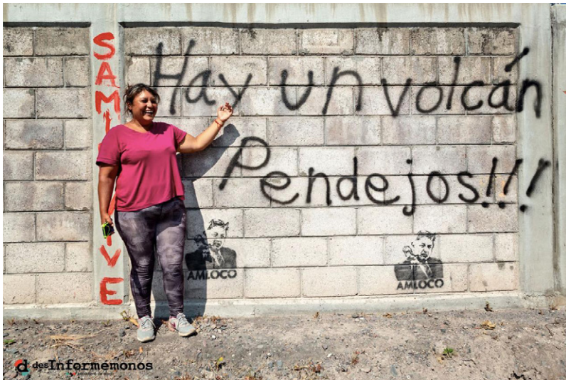
Imagen 3. PIM: Hay un volcán, pendejos!!!

contra las distintas oposiciones. Lxs políticos viven de la imagen, por eso ahora buscan dar la apariencia de ser distintos 'cuando son igual o más puercos que lxs anteriores' (Alan). Incluso, desde un inicio, la 4T buscó apropiarse y vaciar de contenido las propuestas y discursos de las resistencias; por ejemplo, el intento de usurpar el 'mandar obedeciendo' zapatista para servir como estrategia del nuevo gobierno. 63 Esto podría ser entendido ampliamente como lo que Samantha nombra como la 'perversión del discurso de lucha' . A decir de esto, la 4T ha desplegado una fijación con los pueblos indígenas, no solo folclorizándolos, sino también tergiversando sus luchas y vaciando de contenido sus propuestas.